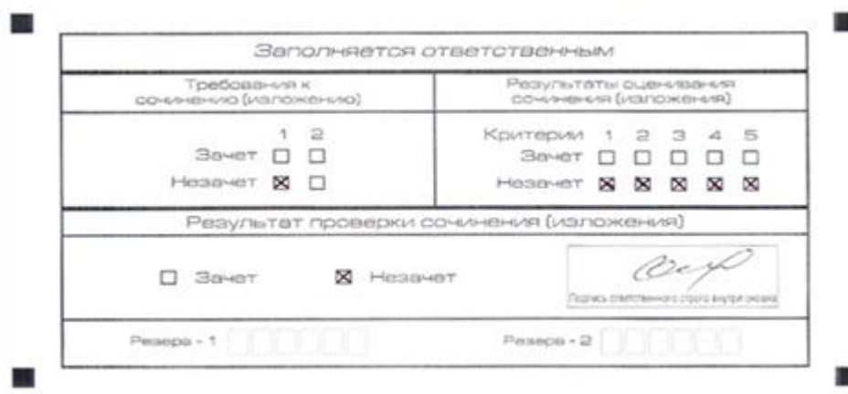
Рис. 1. Область для оценки работы

Если эксперт комиссии по проверке выставляет «незачет» за невыполнение требования № 2, то в клетки по всем критериям оценивания выставляется «незачет». В поле «Результат проверки сочинения (изложения)» ставится «незачет».