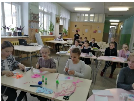
Мастер-класс «Все начинается с любви»