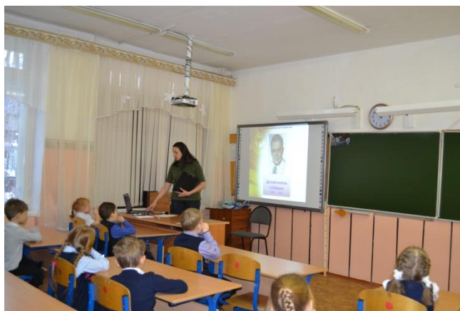
Урок проводит специалист из НБ имени С.Я. Маршак