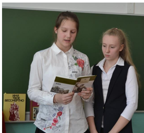
Всероссийская акция «И память книга оживит»