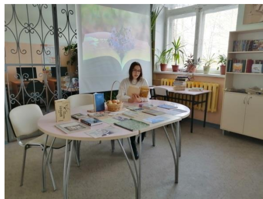
Муниципальная акция «В мире произведений И.А. Бунина»