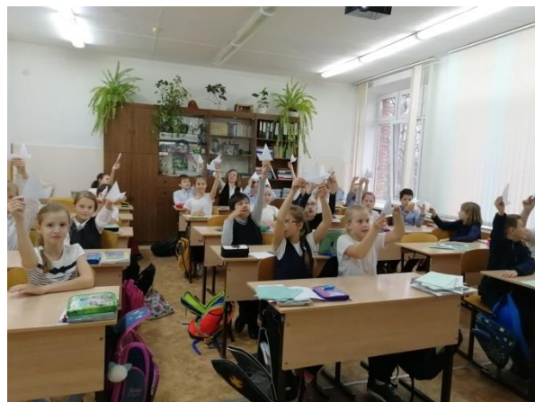
Библиотечный урок «Бумажная победа» в 4 классе