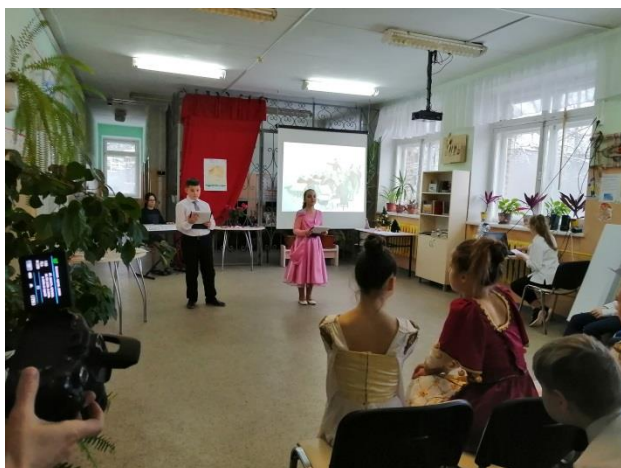
Гостиная «Штраус – король вальсов»