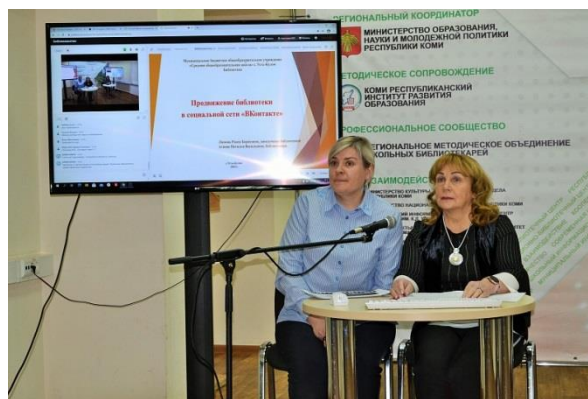
Выступление на Библиохакатоне