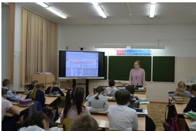
Библиотечный урок «Я иду искать»

В целях привлечения читателей и формирования у школьников информационной культуры чтения, навыков библиотечного пользования проводились библиотечные уроки, организовывались разнообразные выставки, приглашались специалисты из библиотек города, проводились мастер-классы, дистанционные викторины, творческие задания. Учащиеся принимали участие в акциях разного уровня.