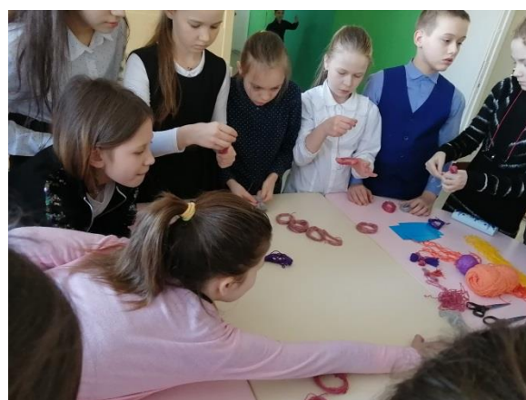
Мастер-класс «Масленичные куколки»