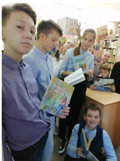
Всероссийская акция «Читаем на перемене»