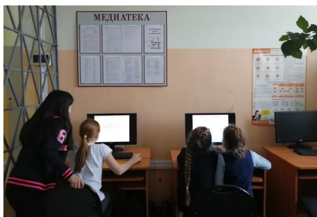
Работа в медиатеке

На полученные средства за победу в республиканском конкурсе «Лучшая школьная библиотека» МИБЦ приобрел мебель и технические средства, что позволило изменить читальный зал библиотеки, сделать его мобильным, удобным для проведения разнообразных мероприятий.