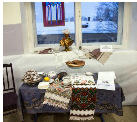
Мастер-класс «Литературные перекрёстки»