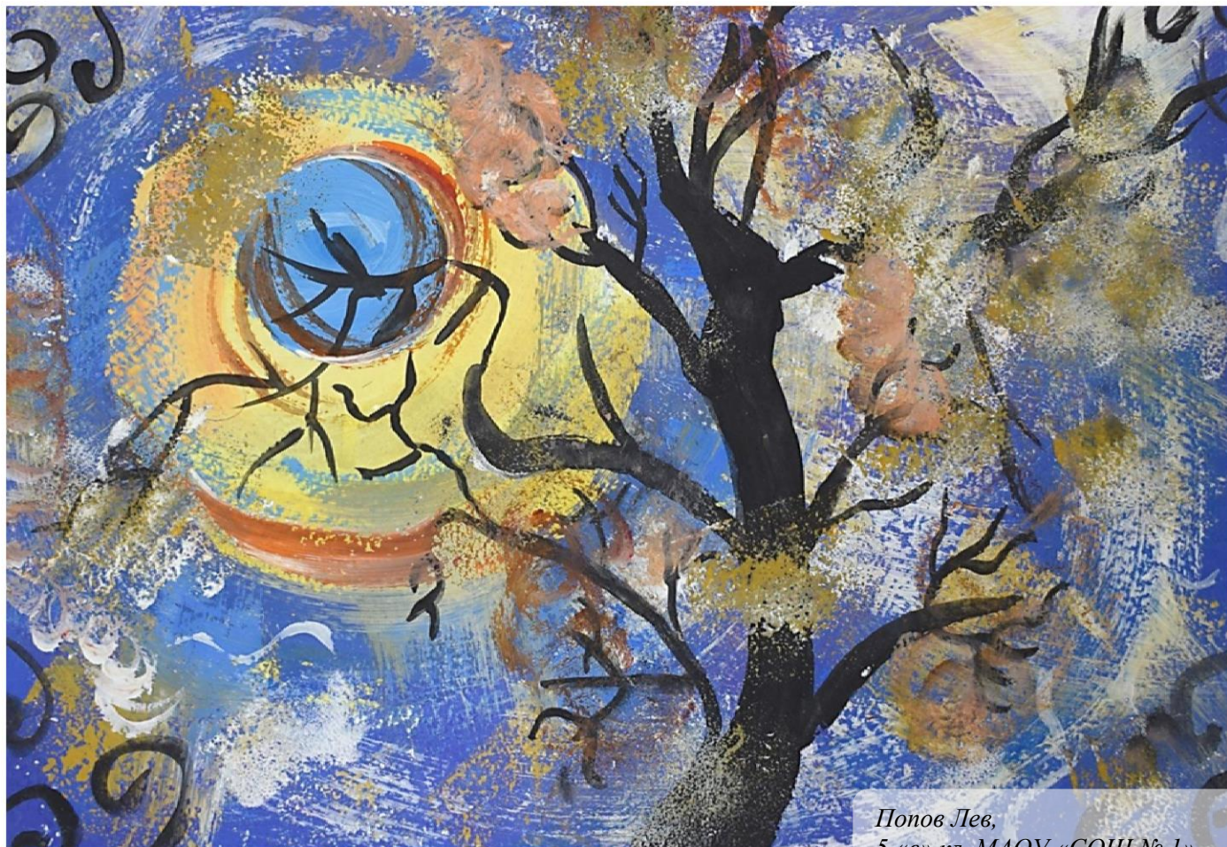
Попов Лев, 5 «в» кл. МАОУ «СОШ № 1»