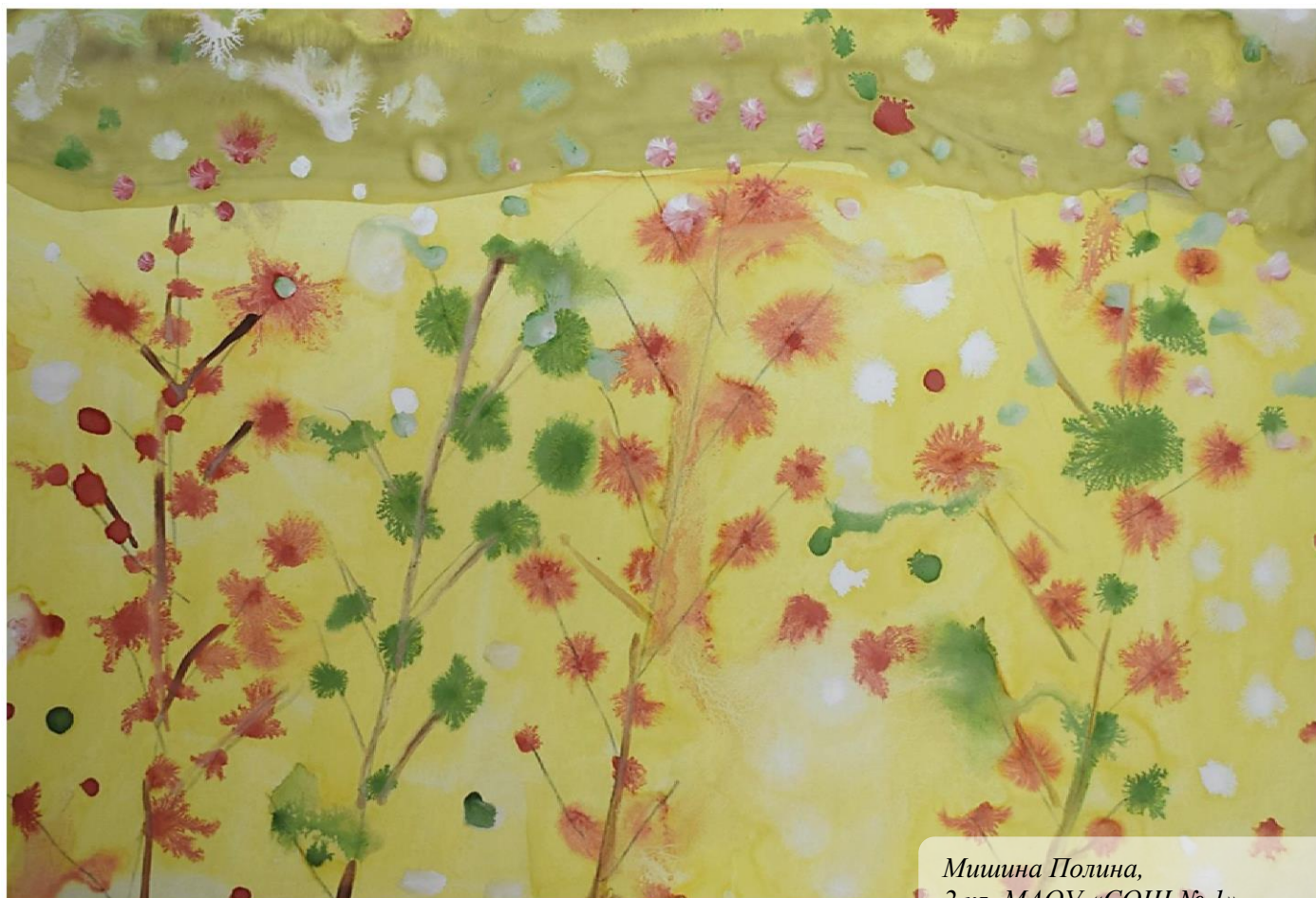
Мишина Полина, 2 кл. МАОУ «СОШ № 1»