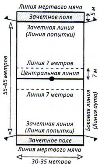
Рисунок 3. Пример полностью размеченной площадки для игры тэг-регби.

Для развлекательной игры в тэг-регби не имеет существенного значения наличие полностью размеченного поля, как показано на рис. 3 ниже. Такие игры могут легко проводиться на полях, размеченных простым прямоугольником, показывающим только две линии аута и зачётные линии, как на рис. 4.