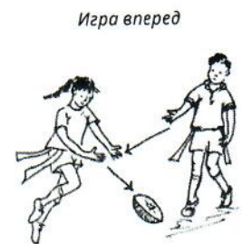
Рисунок 2. Схема паса вперед.