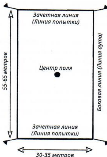
Рисунок 4. Пример разметки площадки для тэг-регби, размеченной не полностью.